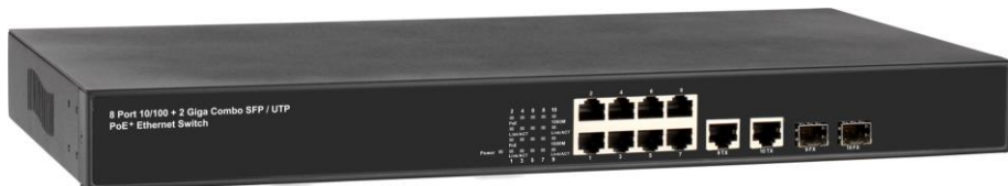
Рис.1 Коммутатор SW-60822/B