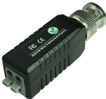
Рис.1 Внешний вид ТР-С/2